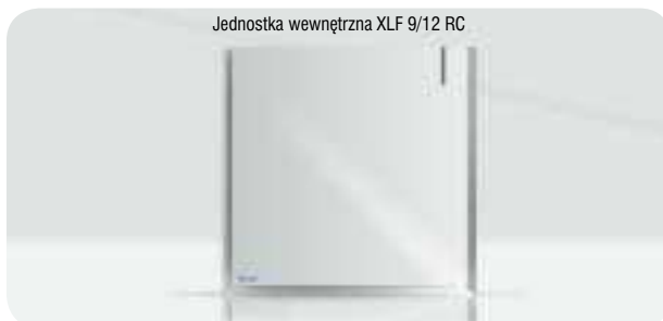
Dostarczane z pilotem RC4